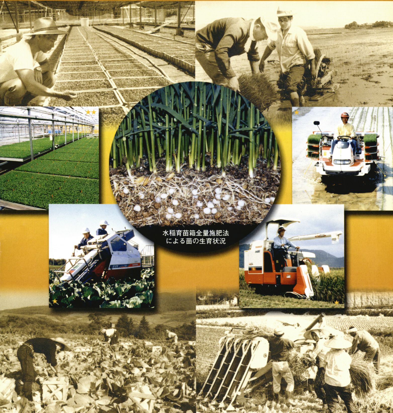
水稲育苗箱全量施肥法 による苗の生育状況